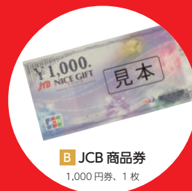
B JCB 商品券 1,000円券、1枚

※対象商品は、「フィオレストーン」に限ります。複数のお申込みでも、記念品はおひとりさま1点とさせていただきます。 ※申込書および使用箇所がわかる図面、仕様書等のデータをメールに添付する際は、拡張子を“.pdf”形式にしてください。 ※記念品は基本的に、弊社の営業担当が直接お渡しいたします。