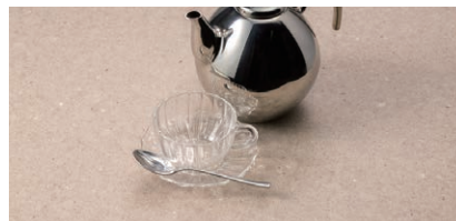
SD56 オートミールテイスト マット