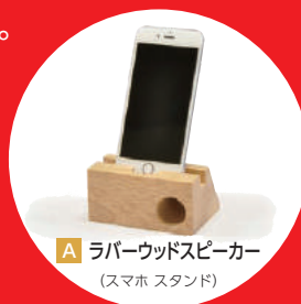
A ラバーウッドスピーカー (スマホ スタンド)

申込方法 裏面の専用申込書に必要事項を記入し、 FAXまたはメールにてご送付ください。