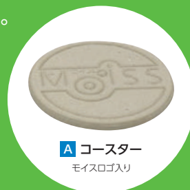
A コースター モイスロゴ入り

申込方法 裏面の専用申込書に必要事項を記入し、 FAXまたはメールにてご送付ください。