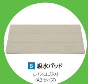
B 吸水パッド モイスロゴ入り (A3 サイズ)

※対象商品は、『モイス NT』に限ります。複数のお申込みでも、記念品はおひとりさま1点とさせていただきます。 ※申込書および使用箇所がわかる図面、仕様書等のデータをメールに添付する際は、拡張子を ".pdf" 形式にしてください。 ※記念品は基本的に、弊社の営業担当が直接お渡しいたします。