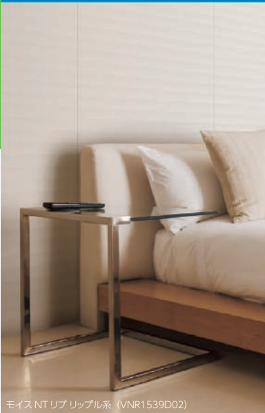
モイス NT リブリップル系 (VNR1539D02)