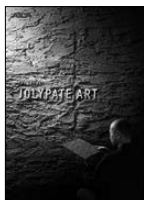
ジョリパットアート