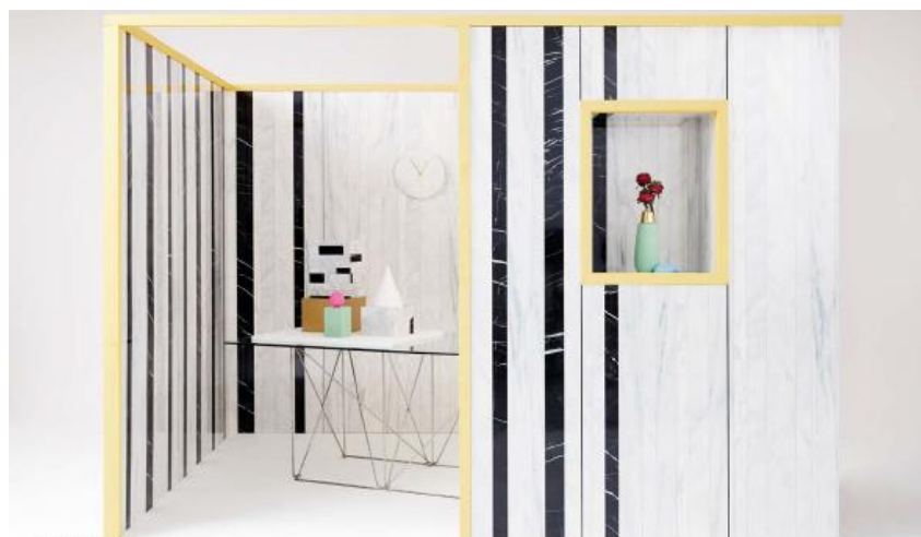
MONOSTONE LINE W4232/TypeA W4233/TypeB

同時開催のデザインセミナーと合わせまして、皆様のご来場を心からお待ちしております。