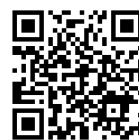
お申し込み ページ