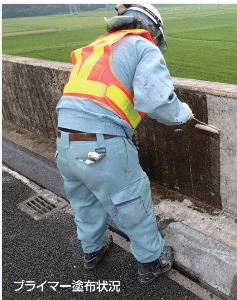
プライマー塗布状況