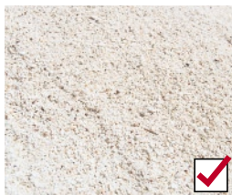
セメントモルタル下地