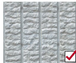
窯業系サイディング下地