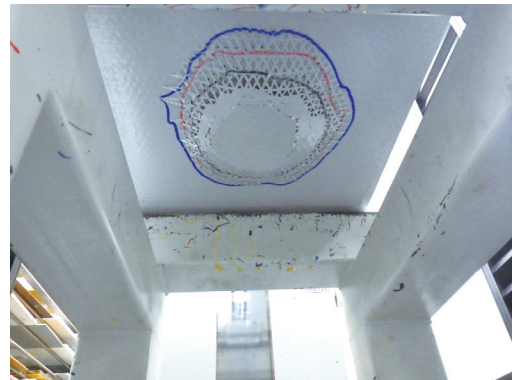
【押し抜き試験状況】

● 本カタログに記載されている製品の使用、取扱い、保管については、必ず製品説明書および安全データシート(SDS)も合わせてお読みください。 共通項目 ● 記載内容は当社試験結果によるもので十分信頼し得るものと考えておりますが、ご需要家各位において使用された結果を必ずしも保証したものではありません。また、使用目的、使用条件により結果が相違する場合がありますので、予めご需要家各位でご確認されることを推奨します。