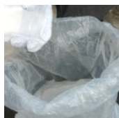
骨材の袋へ硬化剤を投入し、 よく混合する(気温10℃以上 では1袋、10℃未満では2袋)