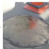
1時間程度で硬化し 開放可能(23℃)