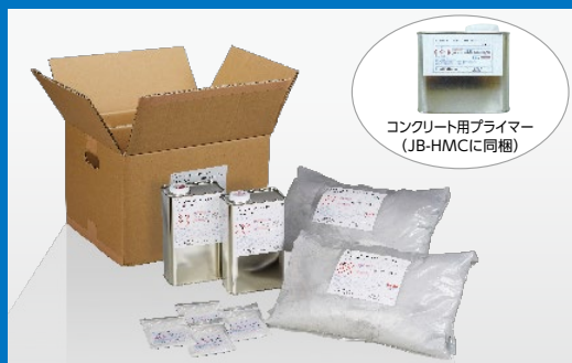
コンクリート用プライマー (JB-HMCに同梱)

【20kgセット(10kgセット×2)】 ・A(樹脂)：1.65kg×2 ・B(骨材)：8.35kg×2 ・硬化剤：23g×4 ・プライマー：300g×1(コンクリート下地用のみ)