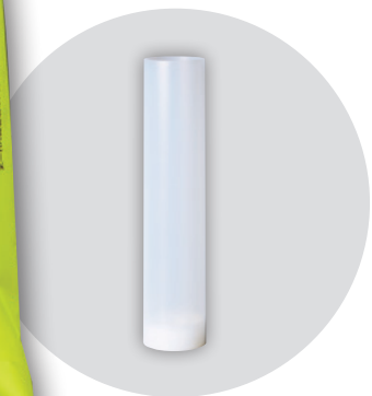
専用ホルダー F-770H10 (別売)