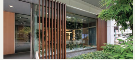
大阪ショールーム Osaka Show Room