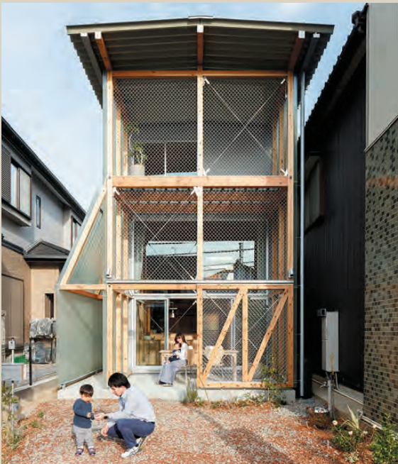
▲豊田の立体最小限住宅 (2022)