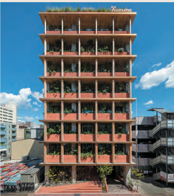
▲GOOD CYCLE BUILDING 001 | 浅沼組名古屋支店改修PJ (2021)