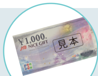
JCB 商品券 1,000円券、1枚